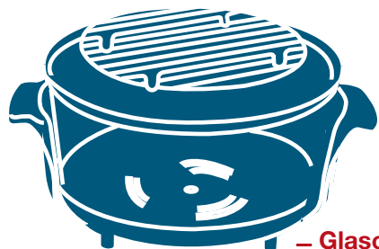
– Glasofenschale –